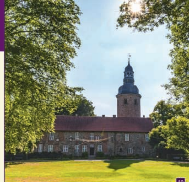
Einmal eines der reichsten Klöster des Erzbistums Bremen: Das Kloster Zeven Gesüdete Romwegkarte aus der Zeit um 1500

VON SEINER REISE IM JAHRE 1236 NACH ROM HINTERLIEB ABT ALBERT VON STADE IN SEINEN REISEAUFZEICHNUNGEN EINE DETAILIERTE WEGEBESCHREIBUNG. AUFGRUND SEINES »STADER ITINERARS« KÖNNEN WIR HEUTE DIE ROUTE WIEDER BEGEHEN UND IN SEINE FÜßSTAPFEN TRETEN.